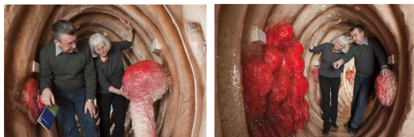
Das begehbare Darmmodell von innen

Das begehbare Darmmodell zeigt die verschiedenen Stadien einer Darmkrebserkrankung. Zu Beginn des acht Meter langen Modells wird ein gesunder Darmabschnitt dargestellt, danach einer mit kleinen Schleimhautpolypen. Geht man weiter, werden die Polypen zwar grösser, sie sind aber immer noch gutartig. Krebszellen entstehen erst danach und können nun ihren Entstehungsort verlassen und dabei Muskelschichten und Darmwand zerstören. Ein Informationsfilm zeigt zudem auf, wie Darmkrebs entsteht, welche Symptome und Risikofaktoren es zu beachten gibt und ist auch mit Erfahrungsberichten von Betroffenen und Angehörigen aufgelockert.